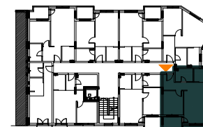
STAN 39 (A407)-DVOSOBAN STAN