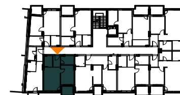
STAN D50 (D406)