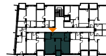
STAN D58 (D505)