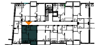
STAN D77 (D706)