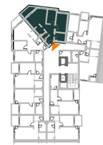
STAN B61 (B607)-TROSOBAN STAN